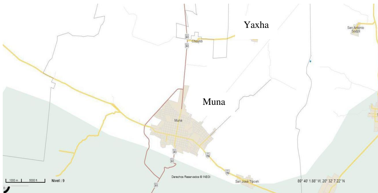
Figura 1. Ubicación de la localidad Yaxha, Muna, Yucatán. INEGI.

Scharager & Reyes (2001), clasifican estos tipos de muestras como dirigidas o intencionales, ya que la selección se basa en la conveniencia, disponibilidad o accesos, los cuales se encuentran condicionados con diversos elementos como la autorización de la autoridad representativa (comisario) y la disposición e interés de los habitantes.